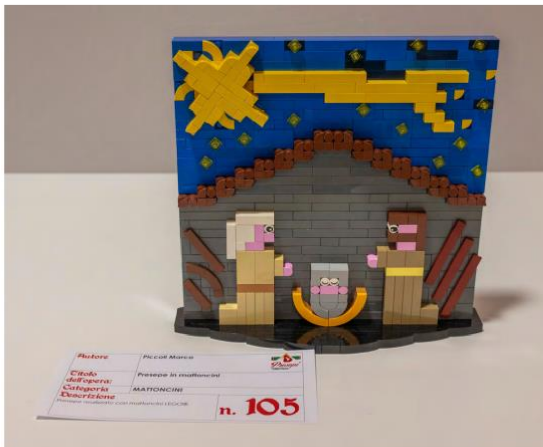
Mostra "100 Presepi" 2024/2025, un presepe della categoria "mattoncini"

edizione, riscuote molto successo perché coinvolge particolarmente i bambini, che già apprezzano i mattoncini e sono abituati a usarli nei loro giochi. La possibilità di utilizzare mattoncini assieme ad altri materiali daranno anche modo di coinvolgere abilità diverse e persone di ogni età nella costruzione del presepe.