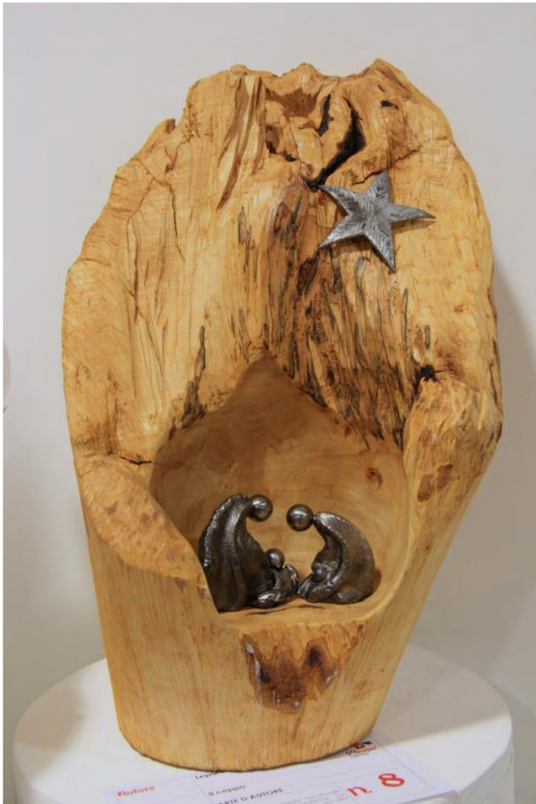
Mostra "100 Presepi" 2024/2025