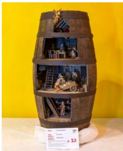
Mostra "100 Presepi" 2024/2025 un presepe della categoria "tradizionale"

Una delle rassegne più seguite, partecipate e apprezzate si svolge da oltre 25 anni all'interno del centro commerciale Città Fiera; un luogo inconsueto, penseranno in tanti, per organizzare una mostra di presepi, eppure dalla sua nascita ha raccolto migliaia di adesioni e decine di migliaia di visitatori, diventando un punto di riferimento per artigiani, semplici appassionati e tanti enti.