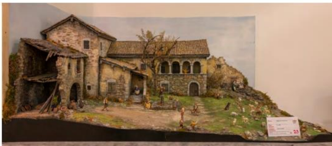
Mostra "100 Presepi" 2024/2025, un presepe della categoria "tradizionale"

La Rassegna "100 Presepi" non è solo una mostra: gli ampi spazi espositivi danno a tutti l'opportunità di coltivare la propria passione, esprimere creatività, manualità e vena artistica. Ogni anno adulti e bambini, scuole e associazioni si cimentano nella realizzazione di presepi di ogni genere, con l'utilizzo dei più svariati tipi di materiali, anche di riciclo.