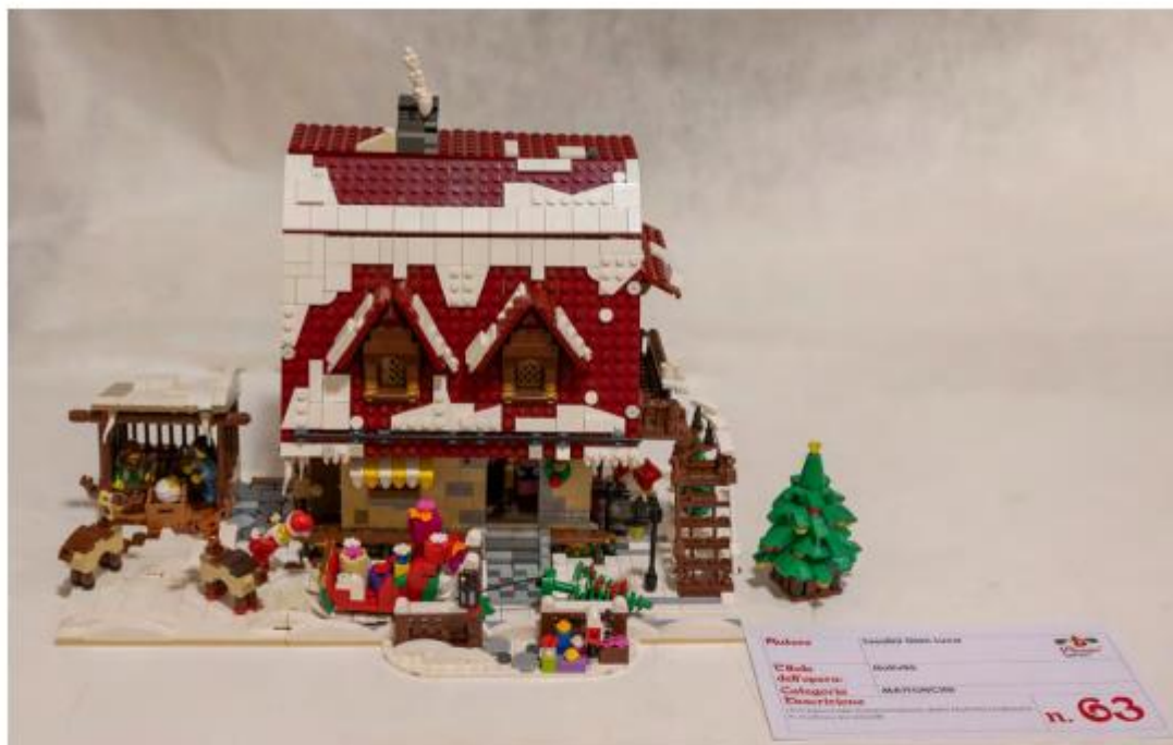
Mostra "100 Presepi" 2024/2025, un presepe della categoria "mattoncini"

Le votazioni potranno essere espresse fino alle ore 10.00 del 12 gennaio 2026 con tre modalità: