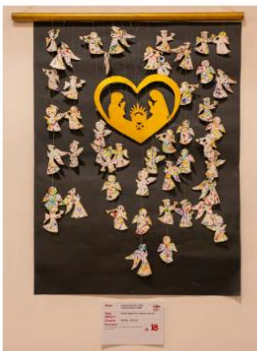
Mostra "100 Presepi" 2024/2025 un presepe della categoria "natura e riciclo"